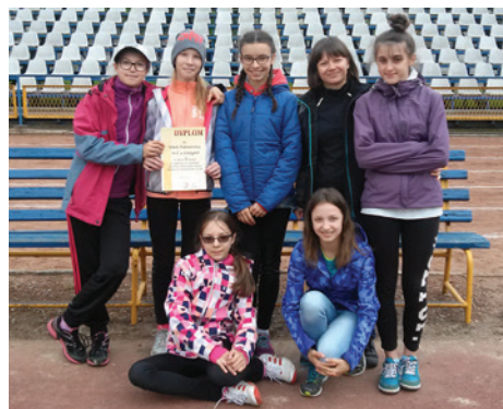
SP2 może się pochwalić zdolnymi lekkoatletkami.