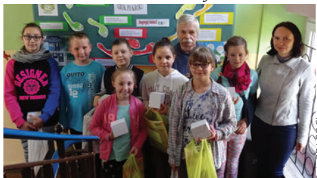
Wręczenie nagród w SP6 w Bażanowicach.