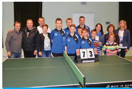
Tenisiści stołowi wkrótce zagrają w trzeciej lidze.