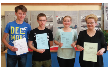
Humaniści są siłą Gimnazjum nr 3.

Jak co roku humaniści z Gimnazjum nr 3 w Cieszynie pokazali swoje możliwości. W tym