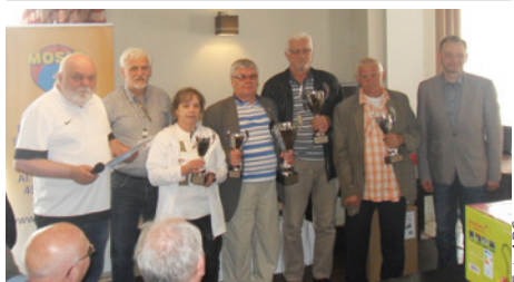
Turniej odbył się już po raz dziesiąty.

14 maja w restauracji WIP przy ulicy Katowickiej odbył się X Turniej Skata o Puchar Burmistrza Miasta Cieszyna, zorganizowany przez sekcję skata KS MOSiR Cieszyn. W turnieju wzięło udział 82 zawodników reprezentujących kluby i sekcje z okręgu Tychy