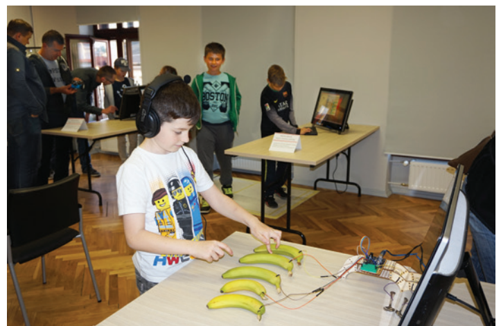
W Bibliotece Miejskiej jak zwykle sporo się działo.