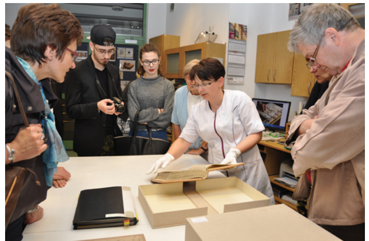
Pokazy konserwacji dawnej książki w Książnicy Cieszyńskiej.