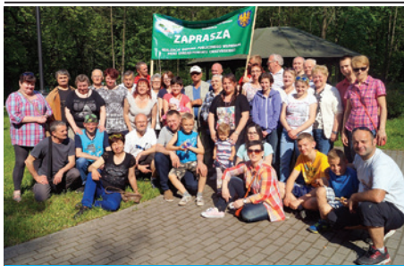
Skoczowianie udanie bawili się w Cieszynie.

Skoczowskie Stowarzyszenie Głuchych zorganizowało zawody sportowe i piknik. Biegi, zawody na kajakach i rowerach wodnych na Campingu Olza cieszyły się dużym zainteresowaniem uczestników, a rywalizacja o pierwsze miejsca była bardzo zacięta. W dalszej części pikniku głusi skorzystali z kompleksu rekreacyjnego miasta Cieszyna. Niejeden z nas nie zdawał sobie sprawy, że za boiskami znajduje się taki piękny teren przystosowany do zrobienia grilla i ogniska. Organizacja zawodów i pikniku dla głuchych była możliwa dzięki otrzymaniu dofinansowania na projekt Sport naszą przepustką do aktywnego życia z zarządu powiatu cieszyńskiego oraz pomocy udzielonej przez Zarząd Campingu Olza w Cieszynie.