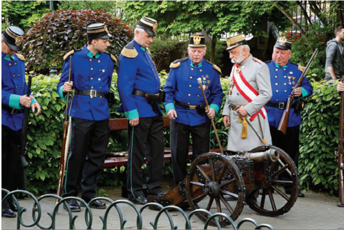
Bractwo Kurkowe nie pozwoliło zasnąć tej nocy.

Ogromnym zainteresowaniem cieszyła się tegoroczna Noc Muzeów w Cieszynie, która odbyła się w piątek 20 maja. Placówki przyjęły więcej gości niż w poprzednich latach. Na przykład Muzeum