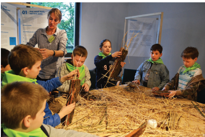
„Zaproś owady do ogródka” – pod takim hasłem w Zamku Cieszyn budowano domki dla owadów.