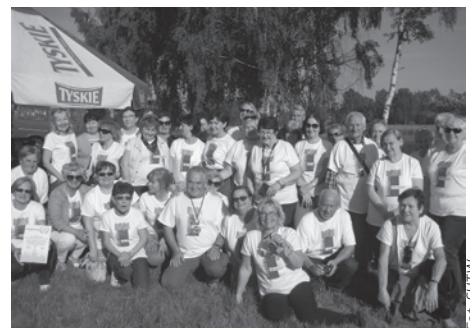
Pamiętkowe zdjęcie uczestników zawodów.