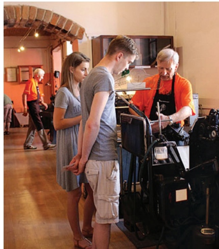
Muzeum Drukarstwa w Cieszynie.

Z okazji Industriady w Muzeum Drukarstwa zaplanowano na przykład prezentację urządzeń czy warsztaty „zrób własny kufel”. Nie trzeba się zapisywać, w przypadku gry miejskiej najlepiej pojawić się przed Muzeum Drukarstwa już ok. godz. 10.15, żeby zgłosić udział. Imprezy w MD potrwać od 10.00 do 17.00. Z kolei w Browarze Zamko-