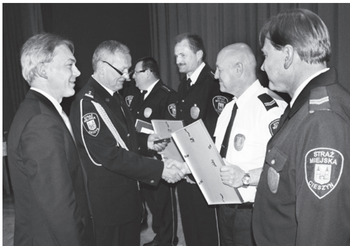
Podziękowanie dla najstarszych stażem strażników miejskich.

Zarządzeniem nr 2 burmistrza Cieszyna z dniem 15 maja 1991 roku została utworzona Straż Miejska w Cieszynie, która świętuje już 25. urodziny. Z tej okazji 20 maja w Domu Narodowym odbyła się uroczysta akademicka, którą uświetniła obecność licznych gości. Oprócz władz samorządowych nie zabrakło przedstawicieli służb mundurowych, komendantów okolicznych straży, przedstawicieli jednostek na co dzień współpracujących ze strażą oraz wielu przyjaciół cieszyńskiej straży. Świątowali również sami strażnicy. Była