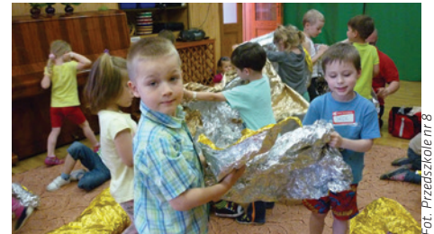
Nauka udzielania pierwszej pomocy.