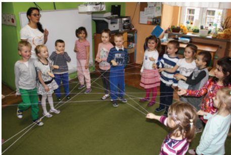
Globalna sieć to dużo wiadomości, ale i zagrożień.

Od stycznia 2005 roku projekt Dziecko w Sieci , już jako kompleksowe działania na rzecz bezpieczeństwa dzieci i młodzieży w internecie, jest realizowany w ramach programu Komisji Europejskiej Safer Internet . Głównym partnerem programu jest Fundacja Orange . W przedszkolu Towarzystwa Ewangelickiego dzięki Fundacji Orange został przeprowadzony cykl zajęć z bezpieczeństwa w internecie – netcio.pl . Spotkania odbywały się przez sześć tygodni. W tym czasie dzieci w bardzo przystępny sposób poznały zasady pracy z komputerem i internetem. Oprócz wykonania ciekawych prac plastycznych wzięły udział w konkursach indywidualnych i grupowych, zakończonych oczywiście nagrodami. Bogata