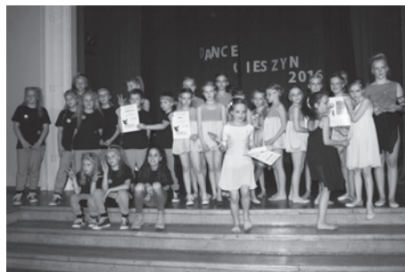
Talentów tanecznych u nas nie brakuje.