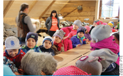
Na wycieczce w Koniakowie.

Pogoda dopisuje, więc w kwietniu grupy starsze pojechały do baczki w Koniakowie. Zajęcia były prowadzone w formie ścieżki edukacyjnej. W baczce grupa zapoznała się z tradycyjnym budownictwem drewnianym oraz sposobem funkcjonowania koliby pasterskiej. Następnie przedszkolaki zostały oprowadzane po gazdówce, gdzie mogły zobaczyć, dotknąć i nakarmić zwierzęta gospodarskie oraz dowiedzieć się, do czego służą poszczególne naczynia.