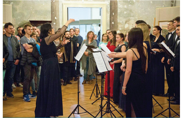
Muzeum Śląska Cieszyńskiego przygotowało wiele atrakcji.